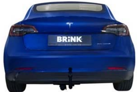
6.- Vista trasera del vehículo con el enganche