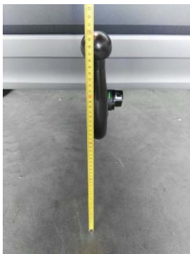
7.- Altura al centro de bola