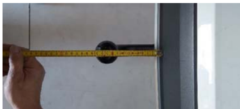
8.- Distancia al centro de bola